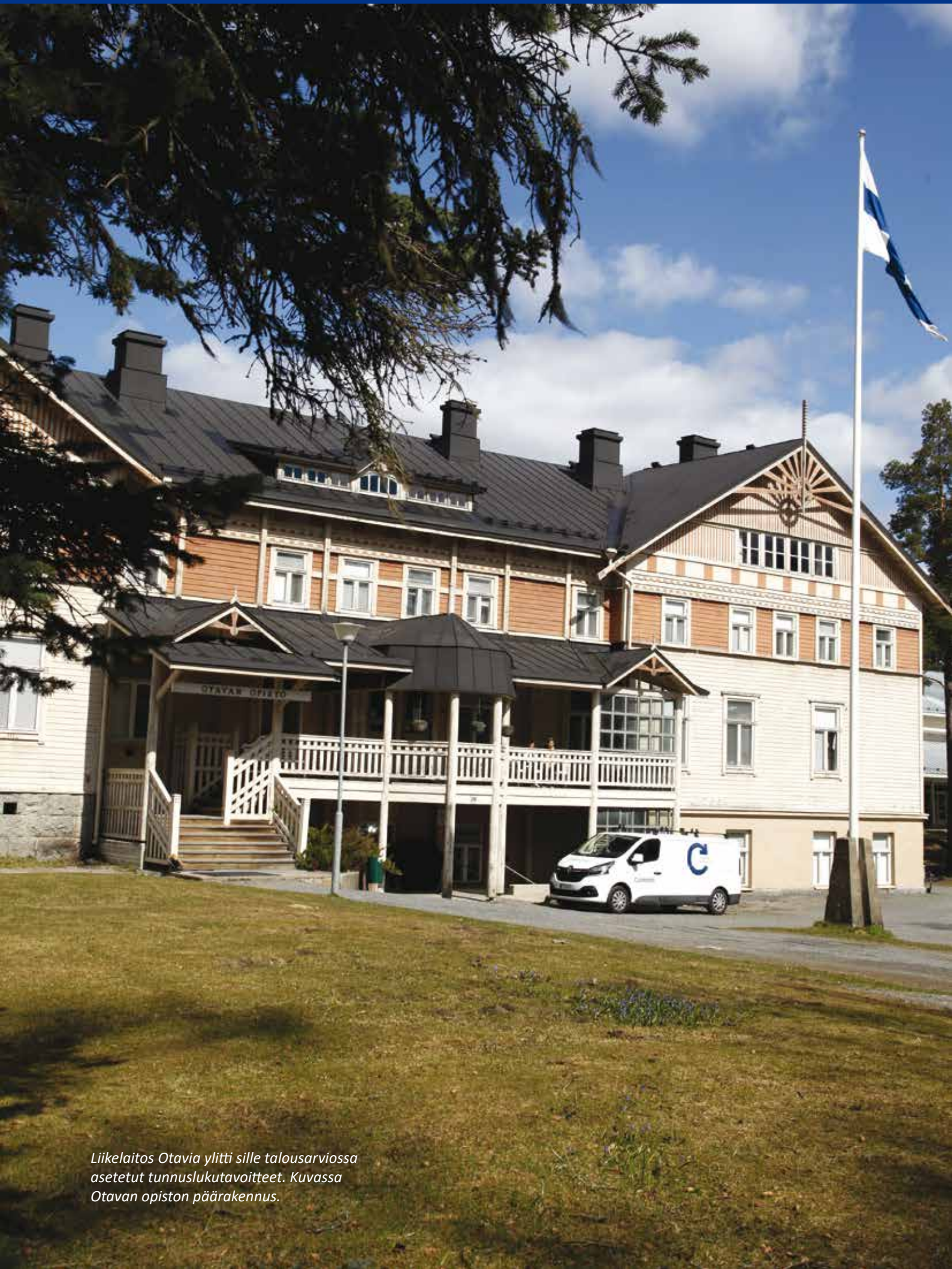
Liikelaitos Otavia ylitti sille talousarviossa asetetut tunnuslukutavoitteet. Kuvassa Otavan opiston päärakennus.